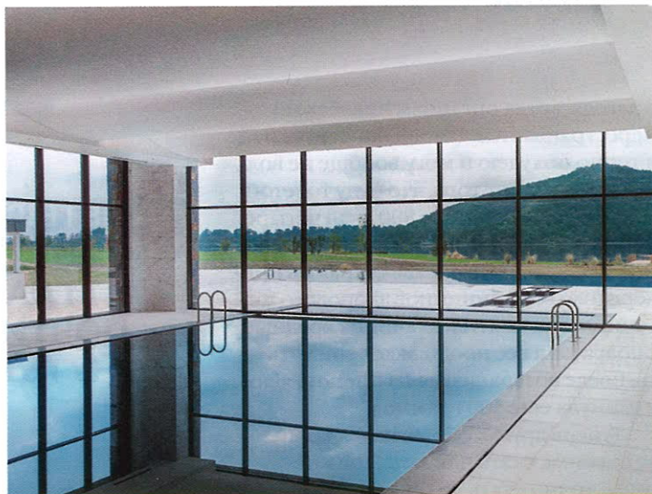
Простор и большое количество дневного света действуют умиротворяюще