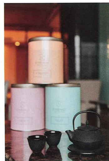
Травяные чаи – важное дополнение к диете

Больше всего он успокоил меня, сказав, что мне просто надо пережить эти