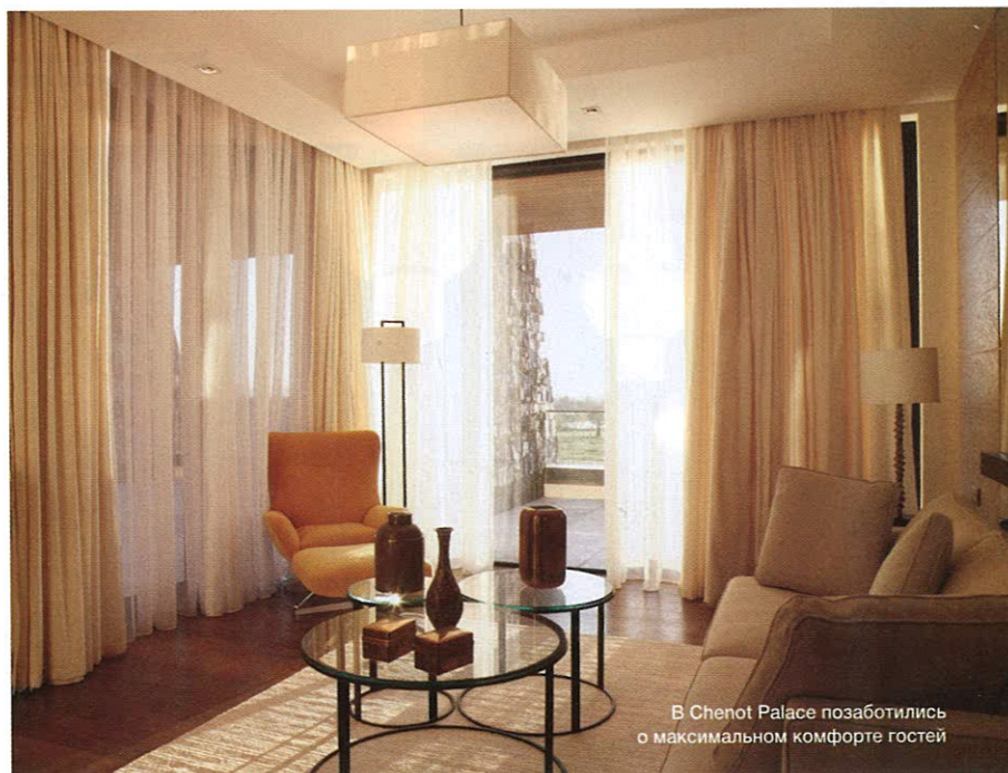
В Chenot Palace позаботились о максимальном комфорте гостей